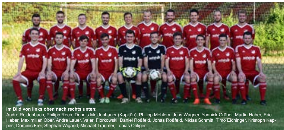
Im Bild von links oben nach rechts unten: